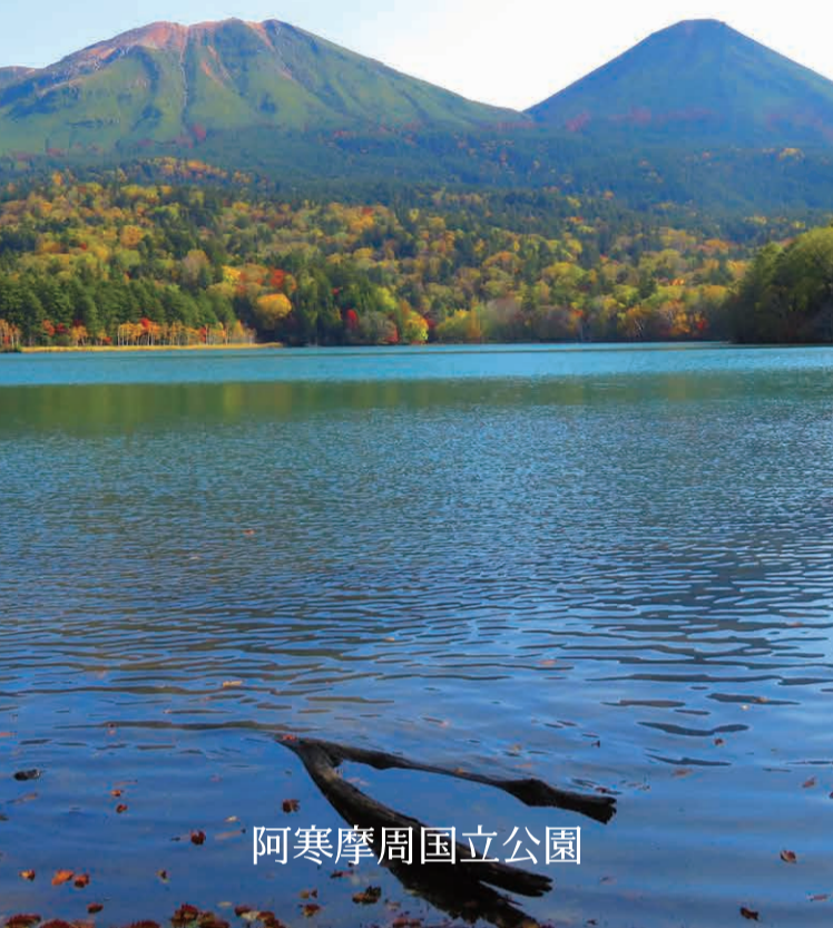
阿寒摩周国立公園